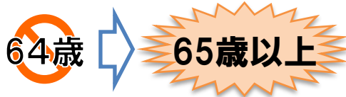
高齢者雇用確保措置 実施義務化年齢の段階的引き上げのイメージ (60歳定年企業において継続雇用制度等を導入の場合)